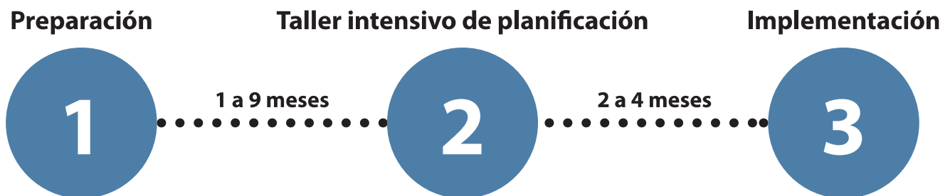
Figura 1. Marco de tres fases del charrette (s.d. de NCI)

Organizar un taller intensivo de planificación requiere preparación. Muchos de los pasos descritos en esta sección